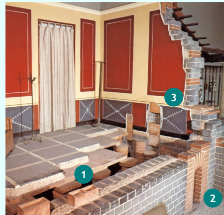
Musées royaux d'Art et d'Histoire, Bruxelles.

Le système de chauffage est bien visible. Le pavement est posé sur des piles cylindriques (1) entre lesquelles circule l'air chaud. Celui-ci est produit par un foyer situé à l'extérieur (2). Dans les murs, des briques creuses assurent le tirage (3).