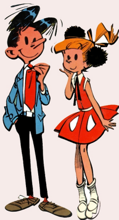
▼ Modeste et Pompon. Dessins d'André Franquin. 1955-1959.

La bande dessinée « Modeste et Pompon », parue de 1955 à 1959, présente des décors intérieurs typiques des maisons de cette époque. Elle est un témoignage particulièrement saisissant des changements qui s'opèrent dans les manières d'habiter des gens de chez nous. L'auteur, André Franquin (1924-1997), est l'un des maîtres incontestés de la bande dessinée. Dessinateur de « Spirou et Fantasio » entre 1946 et 1969, il est aussi le créateur de « Gaston Lagaffe » en 1957. Ses planches sont des chefs-d'œuvre d'intelligence, d'humour et d'expression graphique.