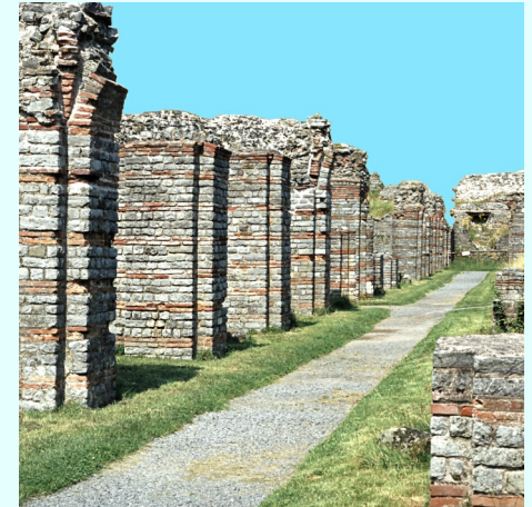
▲ Vestiges archéologiques de la partie souterraine du portique du forum romain de Bavay, côté ouest. Situation actuelle.

Au début de notre ère, le pays des Nerviens devient une région administrative de la province romaine de Belgique. Son chef-lieu est Bavay, au sud de Mons. Vers l'an 100, la ville se dote d'un forum bordé d'édifices publics, de galeries couvertes, de terrasses. Cet aménagement est typique de la façon de concevoir une Grand-Place à cette époque.